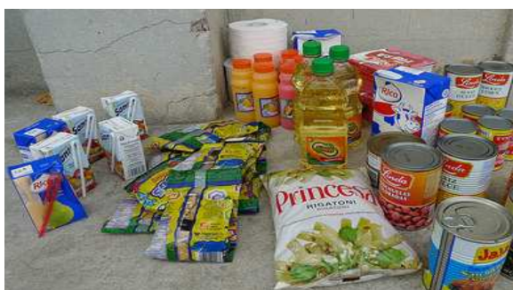
Lote de productos entregados por Cáritas

La red Caritas se movilizó de inmediato para atender a las víctimas del terremoto mediante la distribución de todos los artículos de socorro que estaban disponibles en Haití.