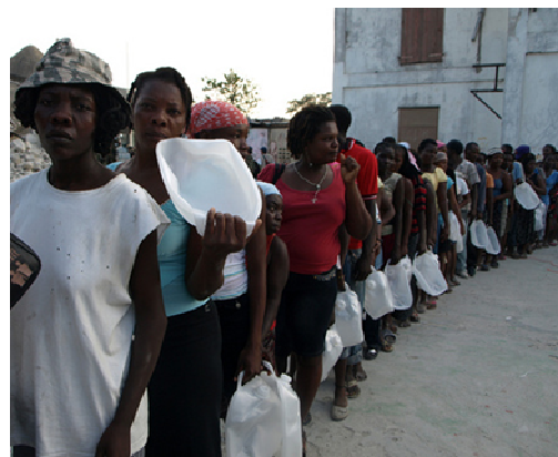
Grupo de damnificados esperan do el reparto